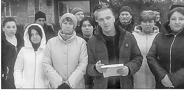
Работники ООО «Новомишастовская птицефабрика» обращаются к А. Бастрыкину.

Работники кубанского ООО «Новомишастовская птицефабрика» с июня по ноябрь 2025 года не получали оплату за свой труд. А в декабре руководство птицефабрики вообще отправило их в отпуск без содержания, хотя все эти сотрудники имели право на оплачиваемый отпуск. Неволя вспоминается басни «демократов» об «эффективных собственниках», которые появляются вместо советских колхозов и «всех накорямт».