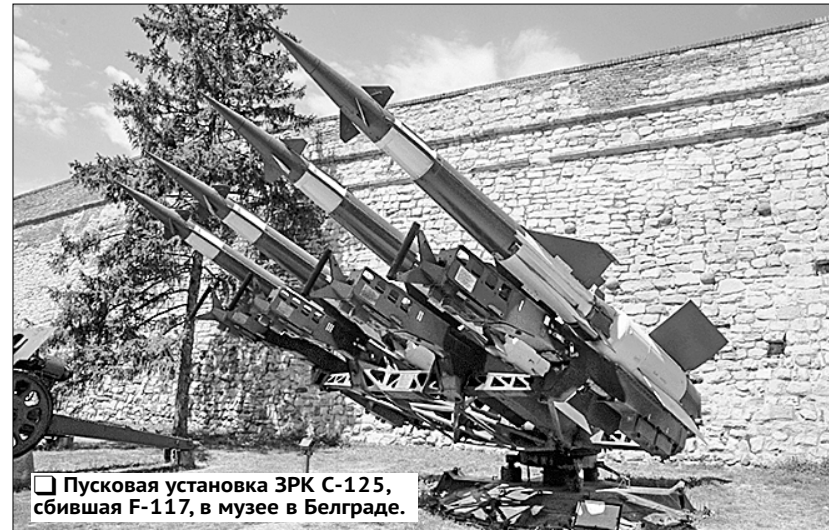
Пусковая установка ЗРК С-125, сбитая F-117, в музее в Белграде.

Неудивительно, что Григорич постарался сохранить способного молодого конструктора в МАИ. В 1952 году Грушин после непродолжительной работы в Бюро новых конструкций Всесоюзного авиационного объединения принял предложение своего научного руководителя