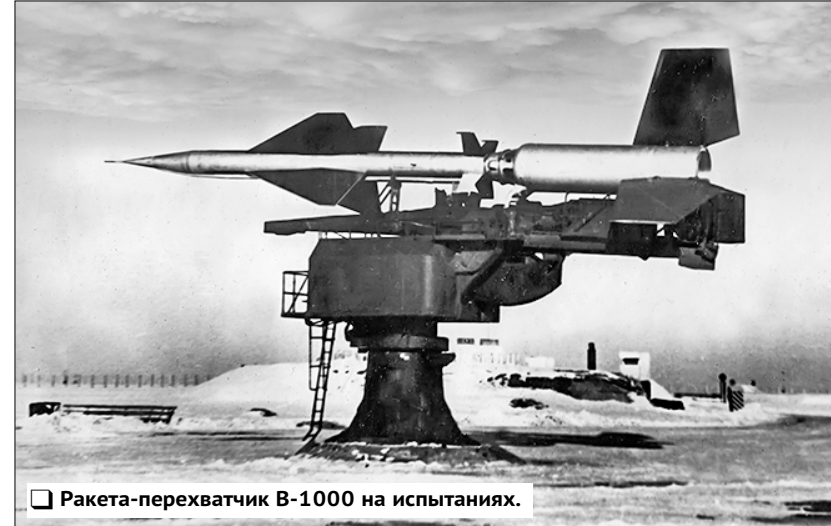
Ракета-перехватчик В-1000 на испытаниях.

Вьетнамская война стала боевым крещением для ещё одного советского ЗРК — С-125 «Нева», того самолёта, который в 1999 году приземлился «невидимку» F-117 в Югославии.