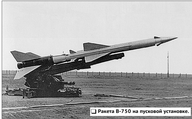
Ракета В-750 на пусковой установке.